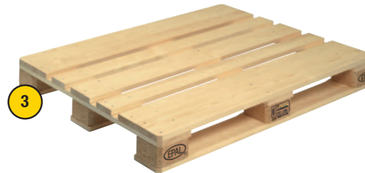
3. EUR 3 Palette - 1000 x 1200 mm