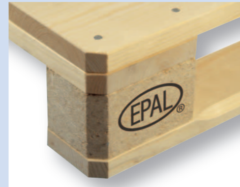
Links das EPAL -Brandzeichen