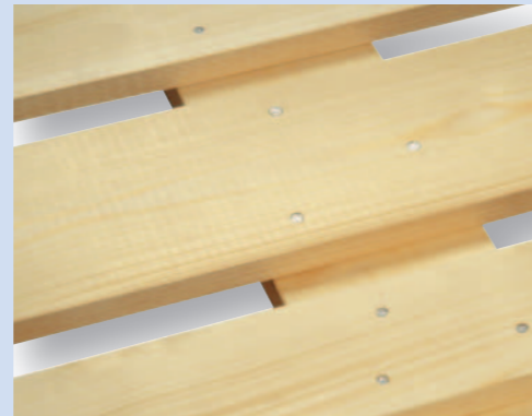
Keine Baumkanten und keine Schimmelbildung