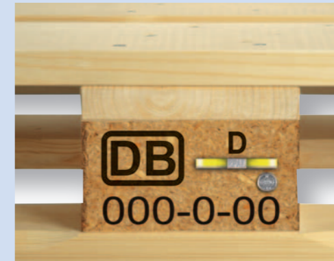
Mittig das Brandzeichen einer europäischen Bahngesellschaft, Land, Herstellercode-Jahr-Monat