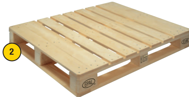
2. EUR 2 Palette - 1200 x 1000 mm