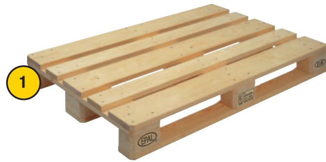
1. EUR Palette - 800 x 1200 mm

Jetzt in 4 verschiedenen Größen erhältlich: