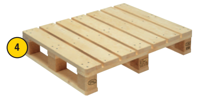
4. EUR 6 Palette - 800 x 600 mm

www.kv-verbeagentur.de • 03-D-08