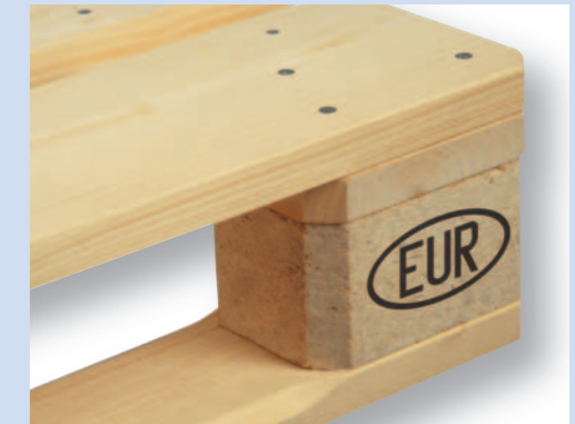
Rechts das EUR -Brandzeichen des europäischen Paletten-Pools der Bahnen